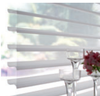
originale – halboffen