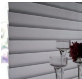
originale – geschlossen