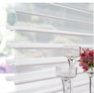
originale – offen

Durch leichtes Betätigen der Bedienschnur können die Lamellen in jeden gewünschten Winkel gebracht werden und ermöglichen so eine optimale Lichtregulierung. Mit der Elektroausstattung lässt sich der Komfort durch eine Fernbedienung noch steigern.